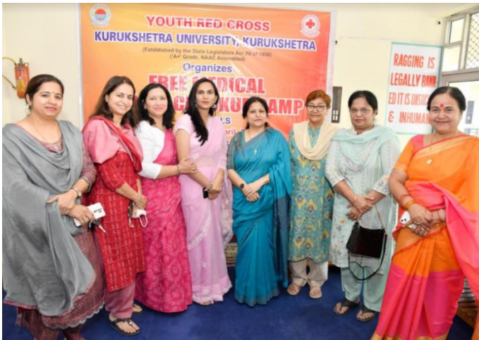
AIDS awareness Programme.