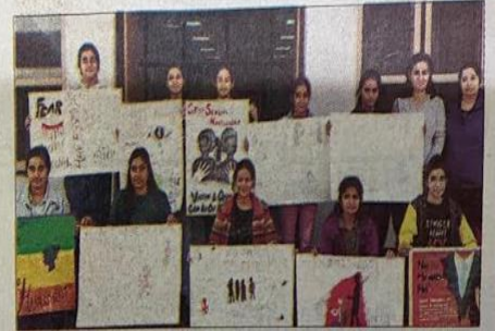
केयू में आयोजित प्रतियोगिता में पोस्टर दिखाती छात्राएं।