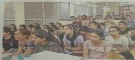
कुवि महिला छात्रावास के लक्ष्मीबाई भवन में आयोजित कार्यक्रम में उपस्थित छात्राएं।