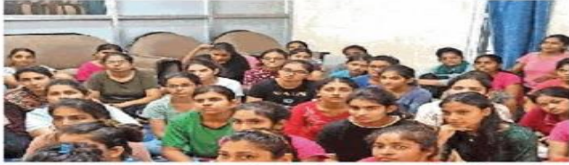
कुवि के सरस्वती भवन में आयोजित कार्यक्रम में उपस्थित छात्राएं।