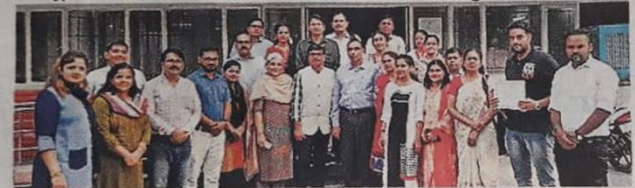
कुरुक्षेत्र | पांच दिवसीय कार्यशाला के समापन पर मौजूद प्रोफेसर व स्टाफ सदस्य।